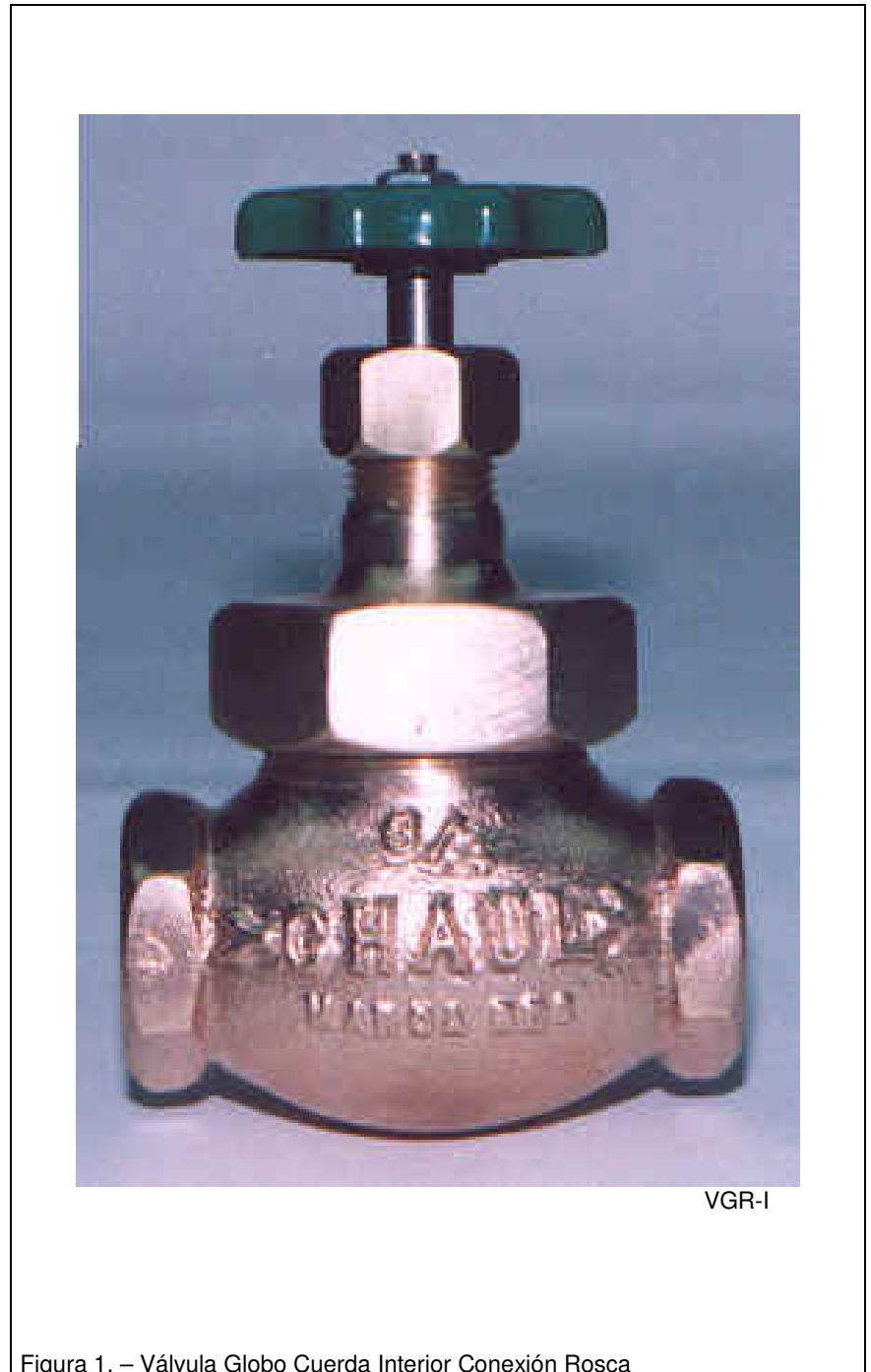
Figura 1. – Válvula Globo Cuerda Interior Conexión Rosca