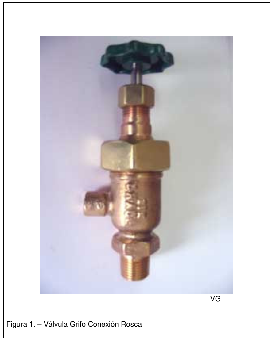
Figura 1. – Válvula Grifo Conexión Rosca

* La válvula grifo cuenta con un sello interior entre el soporte o bonete y el vástago ascendente permitiendo un sello perfecto entre ambas partes, por tal motivo se puede hacer el reempacado de los estoperos estando la válvula totalmente abierta sin tener fugas al exterior.